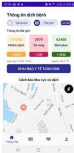
Số liệu thống kê dịch tại Việt Nam