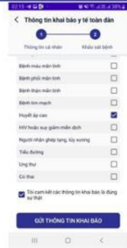
Thực hiện khai báo thông tin sức khỏe & GỬI THÔNG TIN