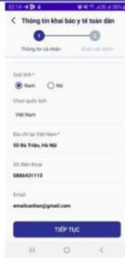
Nhập thông tin cá nhân & Click TIẾP THEO