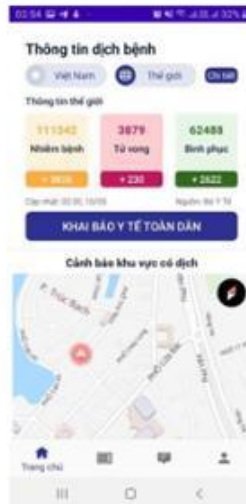
Số liệu thống kê dịch trên Thế giới