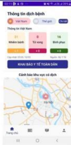
Từ Trang chủ, click KHAI BÁO Y TẾ TOÀN DÂN